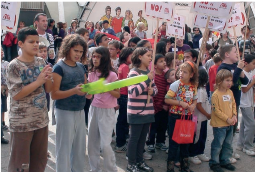
La mobilització de la comunitat educativa durant el passat curs escolar va tenir alguns resultats positius.

La mobilització de la comunitat educativa durant el passat curs escolar va tenir alguns resultats positius. Per les administracions, al mes setembre tot era perfecte, però al novembre van reconèixer que calia una acció d'urgència. Es va signar un protocol sense consulta i a esqueses de la comunitat educativa local. Sindicats d'ensenyament, agrupacions d'AMPES i centres educatius van ser informats de les mesures d'urgència a posteriori.